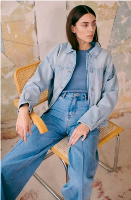
I blue jeans e la giacca in jeans

Altri capi che sono tornati molto di moda: