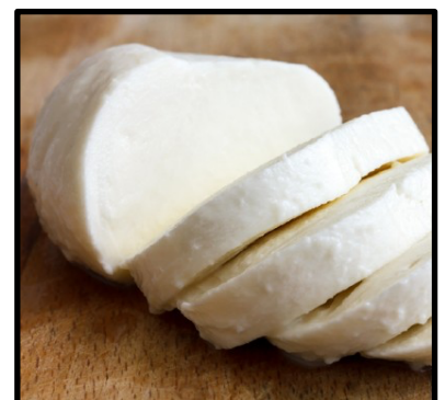
Cagliata dolce tipica rumena^