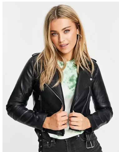
Giacca in pelle